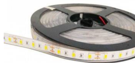
Tira de LED 12V-DC 75W 10mm monocolor IP67 (SMD5630 60ch/m) Rollo 5 metros